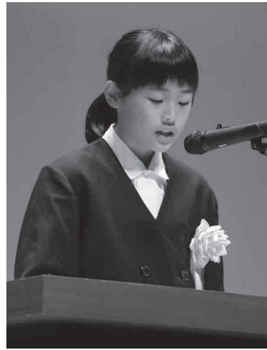
山崎北小学校 5年 (学年は発表当時の学年です。)