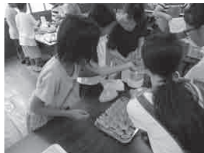
▲合同キャンプの様子