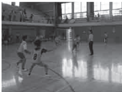
▲ドッジボール大会の様子