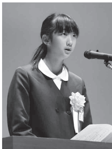
中央小学校 6年 (学年は発表当時の学年です。)