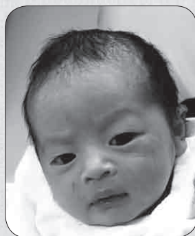
あいり ちゃん (0 カ月)