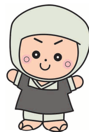
岩出市イメージキャラクター そうへいちゃん