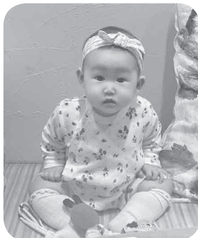
うつきちゃん(7か月)