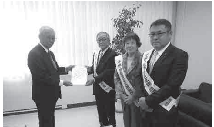
▲巡回活動隊による知事メッセージ伝達の様子

メッセージを受けて、市民の皆様方に今後益々の青少年健全育成に係る取組のご協力をお願いいたします。