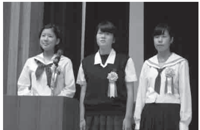
▲司会はやっぱり難しいのか、緊張しています。