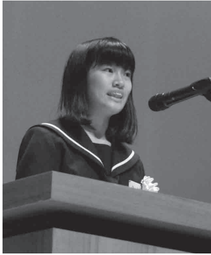
岩出中学校3年 (発表当時の学年です)