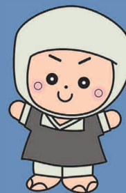
岩出市イメージキャラクター そうへいちゃん