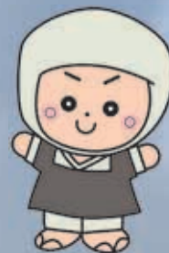
岩出市イメージキャラクター そうへいちゃん