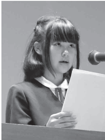
根来小学校 6年 (学年は発表当時の学年です。)