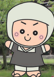
岩出市イメージキャラクター そうへいちゃん