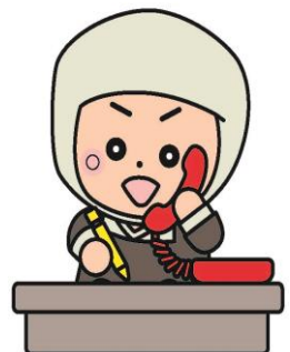
岩出市イメージキャラクター そうへいちゃん