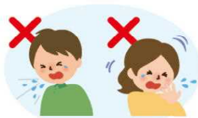
何もせずに咳やくしゃみをする 咳やくしゃみを手でおさえる