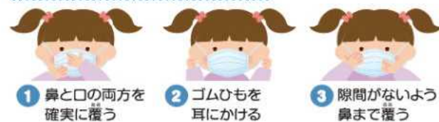
1 鼻と口の両方を確実に覆う 2 ゴムひもを耳にかける 3 隙間がないよう鼻まで覆う