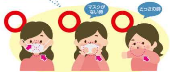
マスクを着用する(口・鼻を覆う) ティッシュ・ハンカチで口・鼻を覆う 袖で口・鼻を覆う