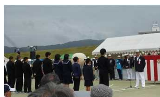
岩出市スポーツ賞の表彰式がありました。

10月14日(月)。岩出市民運動会が行われました。開会式では、岩出市スポーツ賞の表彰があり、本校5年生の女子児童が陸上競技の部で表彰されました。市内の小学校対抗リレーでは惜しくも入賞を逃しましたが、子ども達は一生懸命頑張りました。お疲れ様でした。