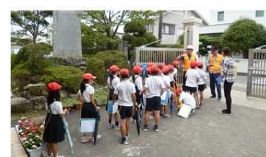
(2年生)町探検に出発しました。

今月も、地域の方々に、子ども達の学習活動を支援してくださいました。1年生は、「さくら公園での秋見つけ」・「いもほり」に、2年生は、「町たんけん」に、3年生は、「スーパー見学」に協力していただきました。いつもお世話になりありがとうございます。