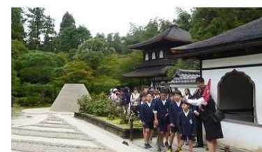
(10/19) 最初に銀閣を見学。