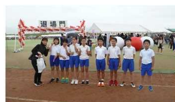
リレーメンバーの皆さんおつかれさまでした。