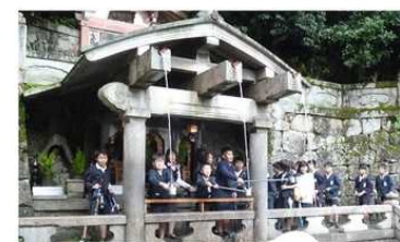
(10/18) 清水寺の音羽の滝で