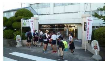
(赤い羽根共同募金)今日は最終日です。

赤い羽根募金、3,979円集まりました。集まった募金は、岩出市社会福祉協議会に届けました。ご協力ありがとうございました。