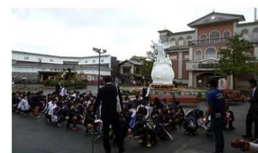
(10/19) 最後の見学場所。太秦映画村に到着