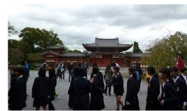
(10/18) 宇治の平等院、鳳凰堂です。