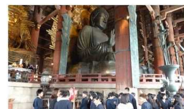
(10/18) はじめに東大寺の大仏の見学です。

10月18日(金)・19日(土)。6年生の待ちに待った修学旅行を実施しました。心配していたほど雨にもあわず、無事二日間の修学旅行を終えることができました。