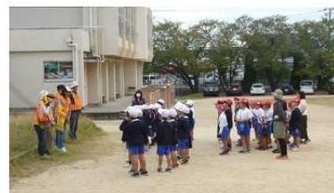
(1年生)さくら公園に秋みつけに行きました。