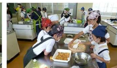
(5年生) JA出前講座で、いなりずしを作りました。