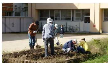
早くから、いもほりの準備をしてくださいました。