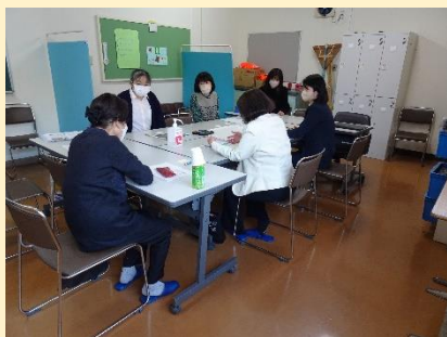
「ボランティア見つけ隊」

「ボランティア見つけ隊」部会では、登録者は40～80代がそれぞれ10名ずつ、男性18名・女性33名の構成であるが、実際に活動している人は20名程度なので、もっと人数が必要であり、校報で募集したり、若い世代に広げたり、各活動に男女別なく参加したりする必要があることが出された。「地域活動部会」では、地域防災訓練、地域クリーン作戦、公園での体操、保育所との連携等の活動を検討していくことが出された。じっくりと計画を立て、人員確保や新たな活動につなげてほしいです。