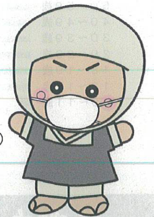
岩出市イメージキャラクター そうへいちゃん