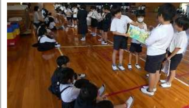
【読み聞かせ交流 1・3年】