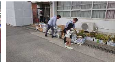
【愛育会リサイクル活動】