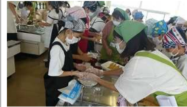
【いなり寿司作り 5年】