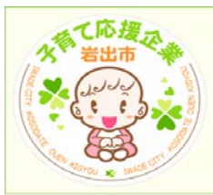
子育て応援企業ステッカー