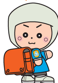
岩出市イメージキャラクター そうへいちゃん