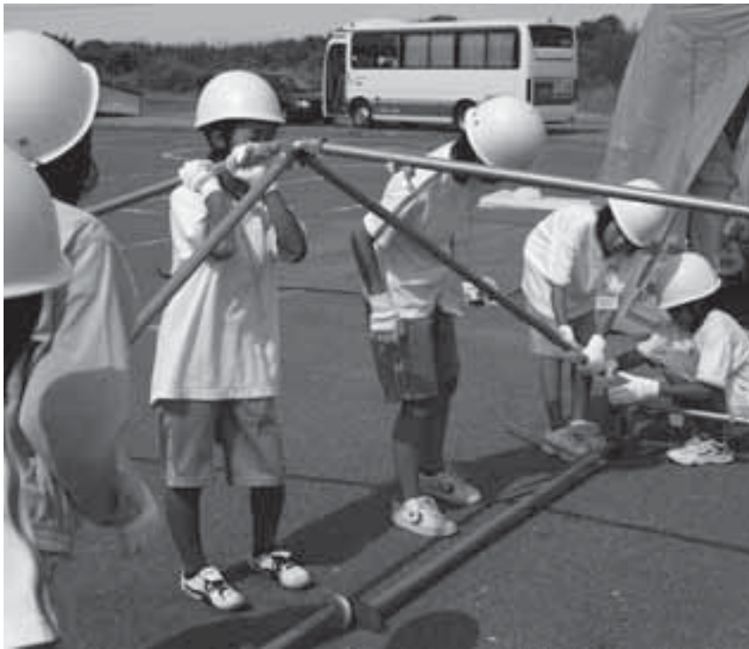
防災ジュニアリーダーによる避難所開設（テント設営）訓練