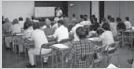
9月6日 山崎公民館での学習会