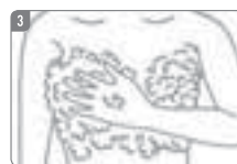
3 お風呂では、スポンジやタオルを使わず、泡立てた石けんなどをつけて、手と指でチェック!