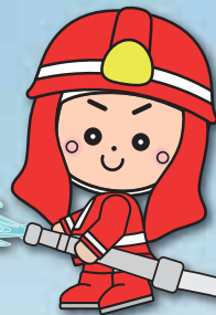
岩出市イメージキャラクター そうへいちゃん