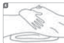
4 仰向けになって、肩の後ろにタオルを敷いて乳房を平たく広げるようにして、乳房や脇の下のしこりをチェック!

その他のがん検診(胃がん・大腸がん・肺がん検診)につきましても、岩出市内実施医療機関にて平成23年1月末日まで受診していただけます。