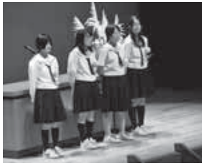
作文発表した中学生