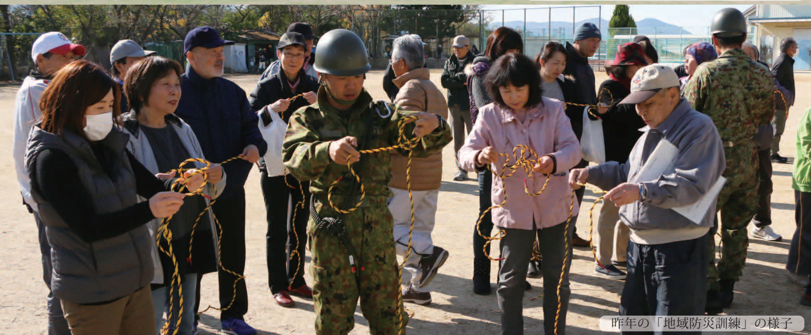
昨年の「地域防災訓練」の様子