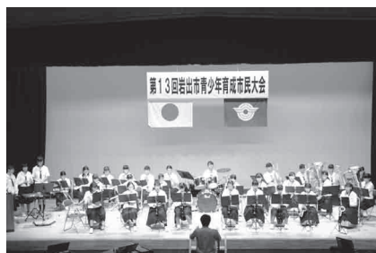
▲岩出中学校吹奏楽部演奏発表