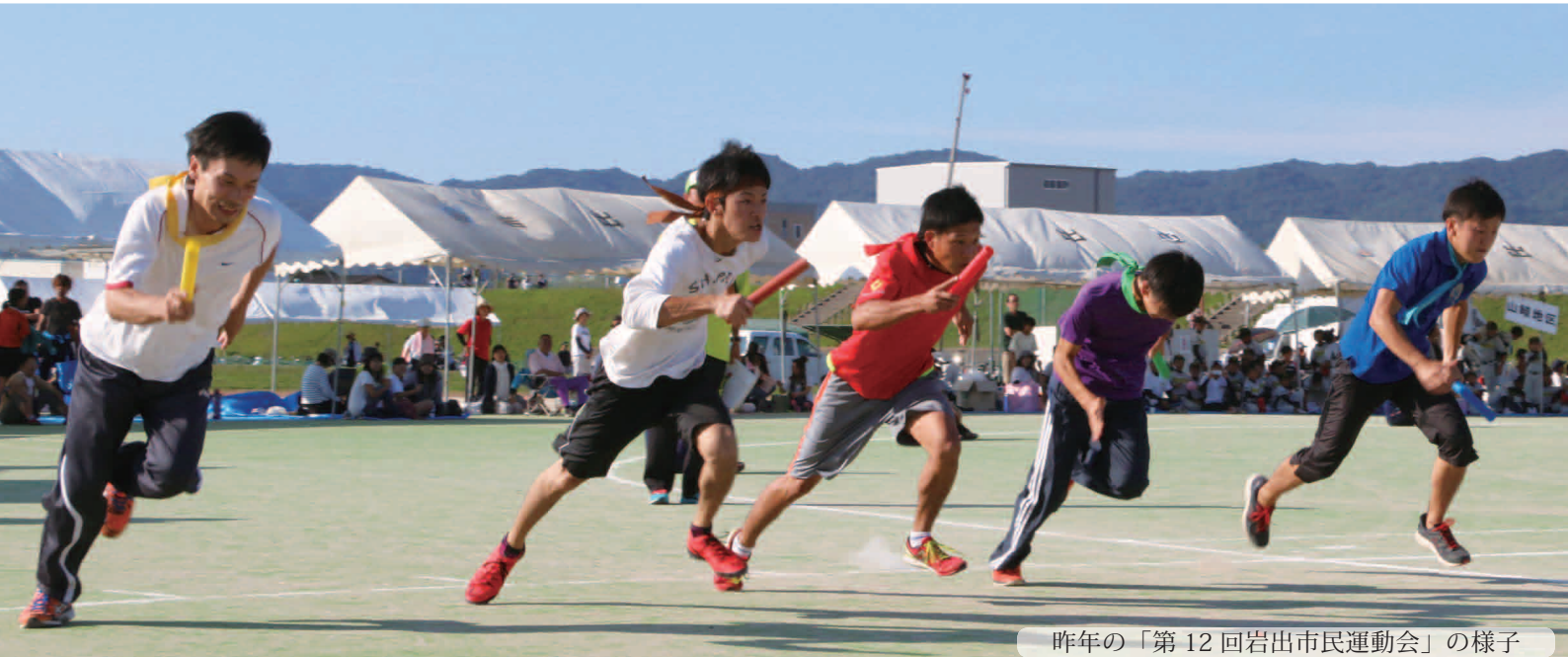
昨年の「第12回岩出市民運動会」の様子