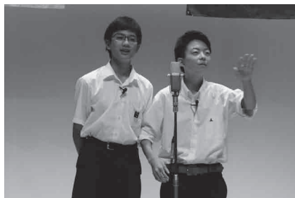
▲アウチさんによる漫才