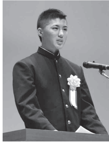
岩出中学校3年 (学年は発表当時の学年です。)