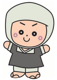
岩出市イメージキャラクター そうへいちゃん