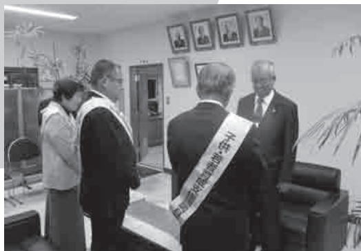
▲巡回活動隊による知事メッセージ伝達の様子

去る11月5日（火）和歌山県から令和元年度子供・若者育成支援強調月間に係る「知事メッセージ」を携えて、巡回活動隊（キャラバン隊）が来庁し、岩出市長への「伝達式」が行われました。