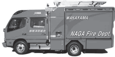
▲水槽付消防ポンプ自動車（CD-1）

車両の特性や装備を活用し様々な災害に対応できるよう、消防技術の更なる向上に努めてまいります。