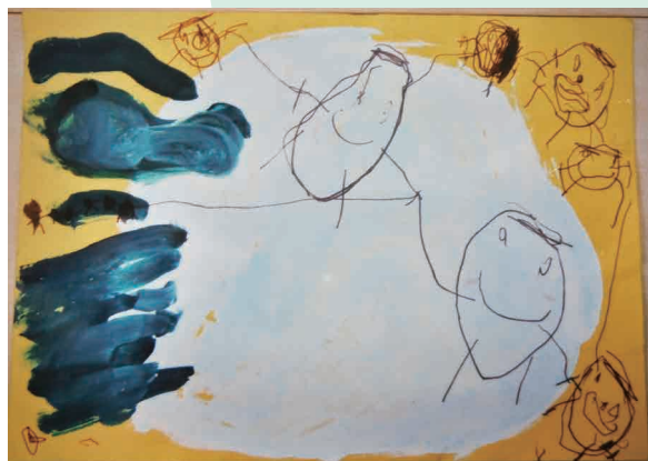
題名 「おおきなかぶ」