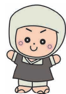
岩出市イメージキャラクター そうへいちゃん