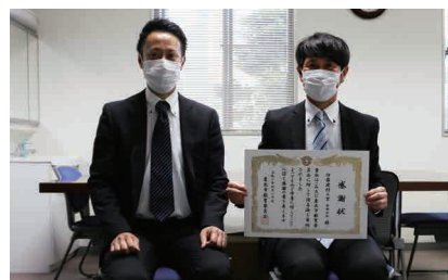
▲伊藤建材工業有限会社様