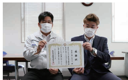
▲赤井工業株式会社様