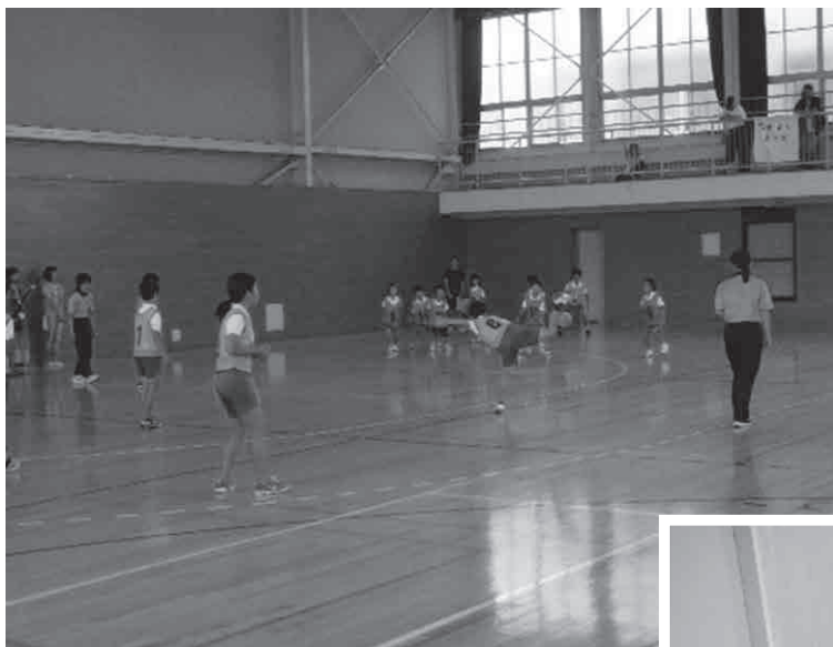
▲ドッジボール大会の様子

問 岩出市地域活動連絡協議会事務局 (生涯学習課生涯学習推進係) ☎ 62-2141