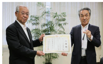
▲株式会社吉村秀雄商店様