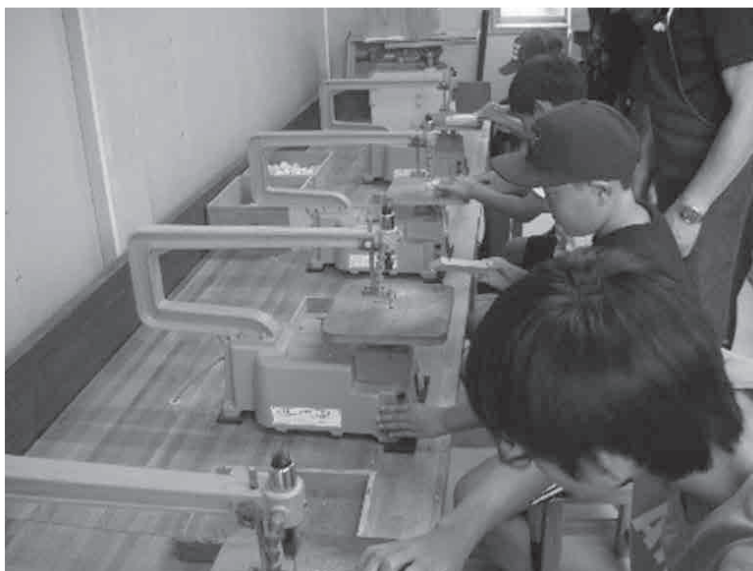
▲合同キャンプの様子(木工細工)