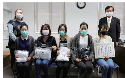
▲有限会社エイ・ケイ・エム様

いただきました品は、市の感染予防などに大切に活用させていただきます。温かいご支援をいただき、誠にありがとうございました。