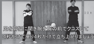
足並肩幅に開き腕を胸の前でクロスして 4秒かけて座り4秒かけて立ち上がりましょう