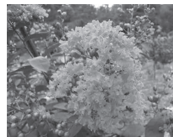
イッサイサルスベリ

※新型コロナウイルス感染拡大防止の観点から、 当面、催し物等を中止させていただきます。