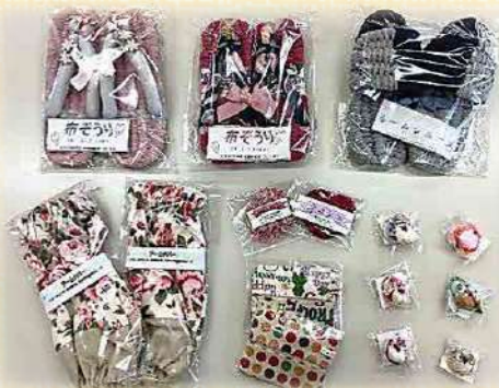
パン・お菓子・雑貨等