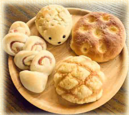
ナチュラルベーカリーharu

販売する製品はどれも手づくりの思いがこもった すてきなものばかりです。 どうぞマルシェをのぞいてみてください。