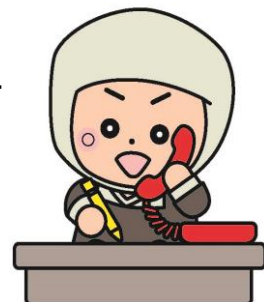
岩出市イメージキャラクター そうへいちゃん