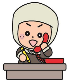
岩出市イメージキャラクター そうへいちゃん

● 和歌山県消費生活センター 和歌山市手平2丁目1-2 県民交流プラザ和歌山ビッグ愛8F 電話：073-433-1551 FAX：073-433-3904 (月～金) 9:00～17:00 (土・日) 10:00～16:00 (電話相談のみ) (祝日・年末年始を除く) ● 岩出市役所 市長公室 岩出市西野209番地 電話：0736-62-2141 FAX：0736-63-5229 (月～金) 8:45～17:30 (土・日・祝日・年末年始を除く) 消費生活相談窓口 第1・3火曜日 13:00～16:00 電話：0736-62-2141 FAX：0736-63-5229 ※詳細は、岩出市ウェブサイトや広報紙でご確認ください。