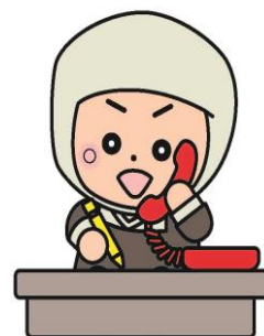
岩出市イメージキャラクター そうへいちゃん