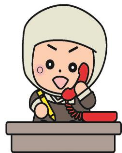
岩出市イメージキャラクター そうへいちゃん