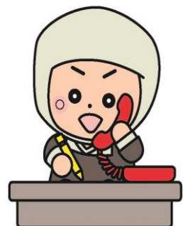
岩出市イメージキャラクター そうへいちゃん

電話：0736-62-2141 FAX：0736-63-5229 消費生活相談窓口 第1・3火曜日 13:00～16:00 電話：0736-62-2141 FAX：0736-63-5229 ※詳細は、岩出市ウェブサイトや広報紙でご確認ください。