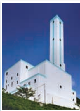
クリーンセンター

For the purpose of efficient administrative management, the personnel will be appropriately allocated under the staff optimization plan.