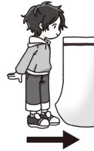
できるだけ前のほうに立つ