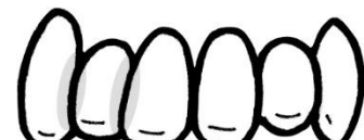
歯と歯がかさなったところ