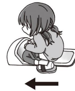
べんきの前のほうにしゃがむ