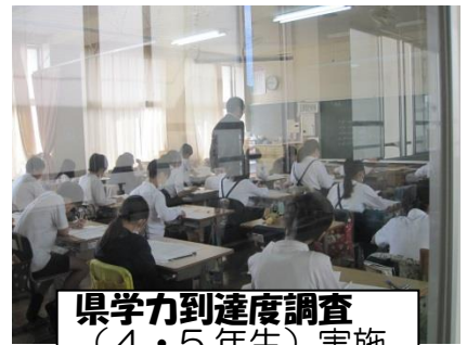
県学力到達度調査 (4・5年生)実施