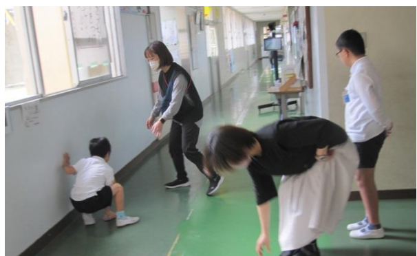
たんぽぽ学級 教室から廊下へ～数を実感した算数の学習