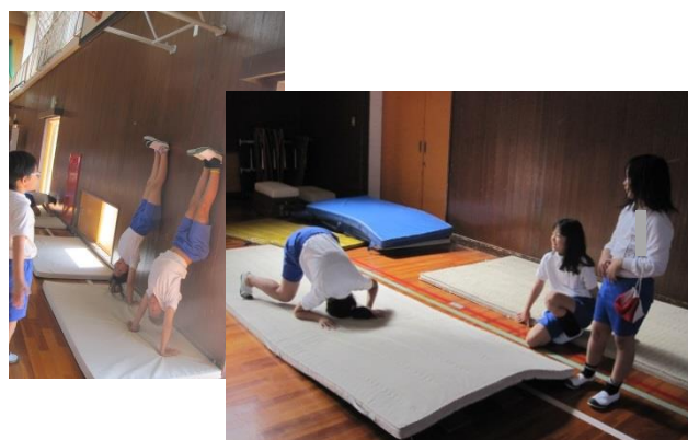
4年生 友達と一緒に技をみがいたマット運動