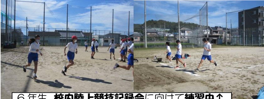
6年生 校内陸上競技記録会に向けて練習中↑