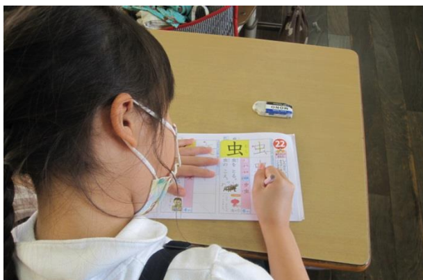
1年生 正しく書いておぼえた漢字の学習