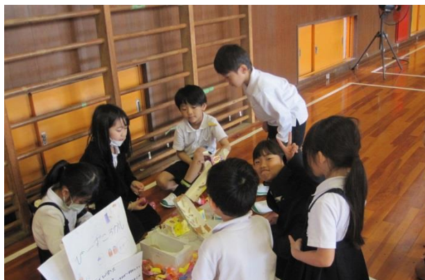
2年生 1年生を招待したおもちゃランド(^_^)