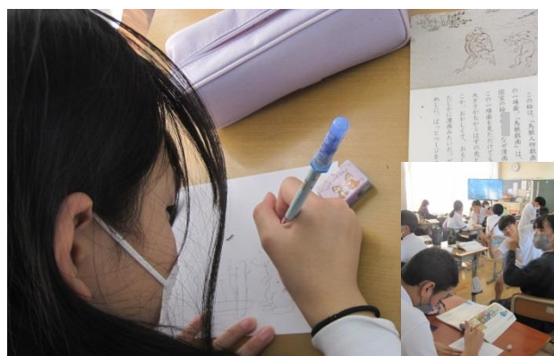
6年生 現代版鳥獣戯画に挑戦～図工の時間