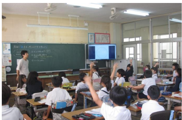
3年生 まるい形のかき方を考えた算数の学習