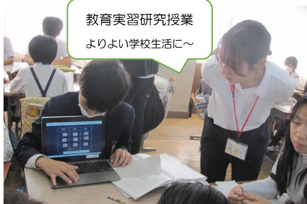
5年生 グループで話し合った国語の学習