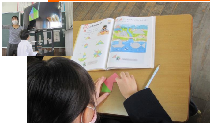
1年生 カードでかたちづくりをした算数