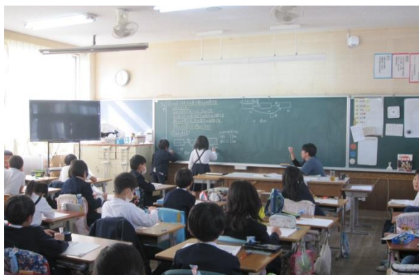
3年生 「何倍でしょう」じっくり考えた算数