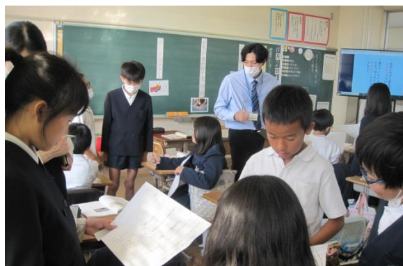
4年生 説明文の例の役割について考えた国語