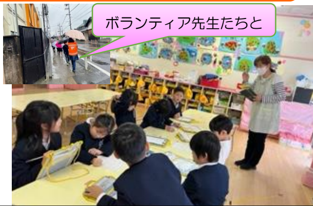
2年生 保育所や郵便局など 町たんけんへ