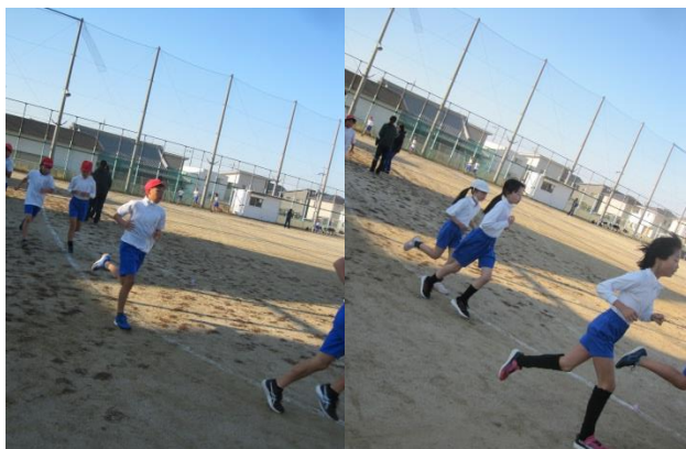
桃源郷駅伝競走大会に向けて 早朝練習 早起きして毎日励んでいる かわいい姿☆