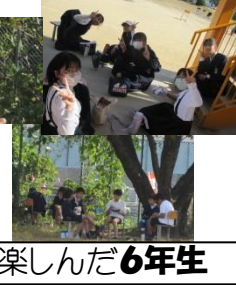
学校で楽しんだ6年生