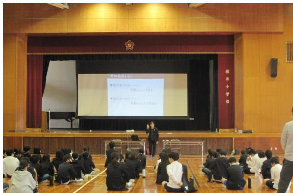
5年生 初めて知ったことが多かった手話教室