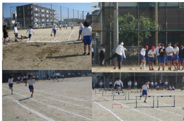
6年生 走った!跳んだ!投げた! 校内陸上大会