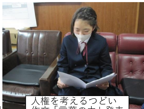
人権を考えるつどい 作文「言葉の力」発表