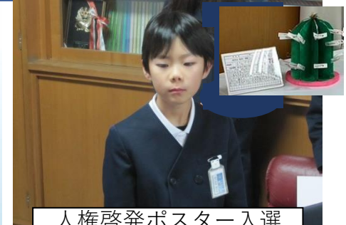
人権啓発ポスター入選 私たちのくふう展入賞