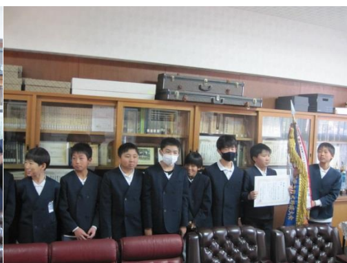
岩出市スポーツ少年団 野球「根来ファイターズ」 県大会優勝