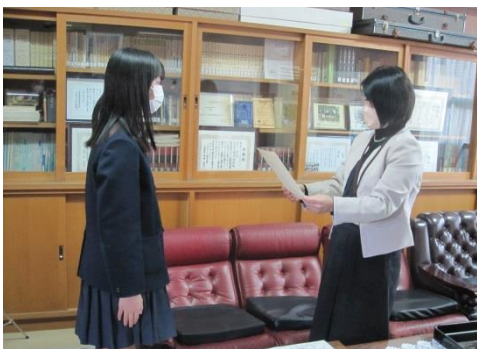
校内マラソン大会 各学年1～6位 代表6年男子1位 女子1位