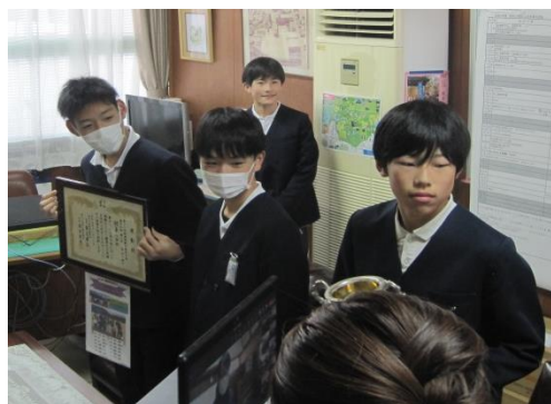
桃源郷駅伝競走大会 男子3位