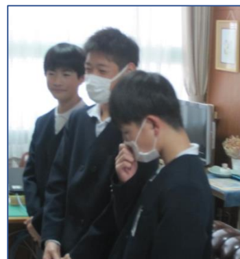
和歌山県小学生タスキリレー大会 男子の部 第2位（県記録更新）