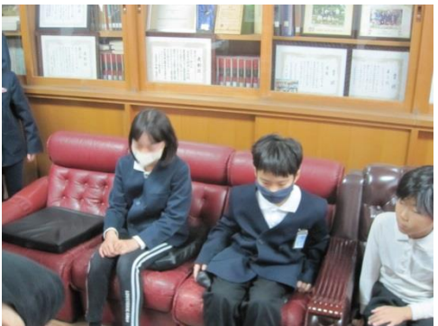
防火・防災ポスター 優秀賞・佳作