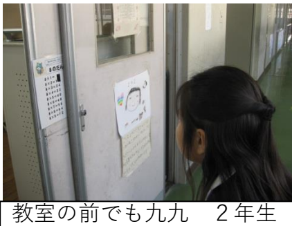
教室の前でも九九 2年生