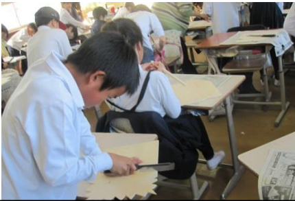
のこぎりを上手に使った4年生