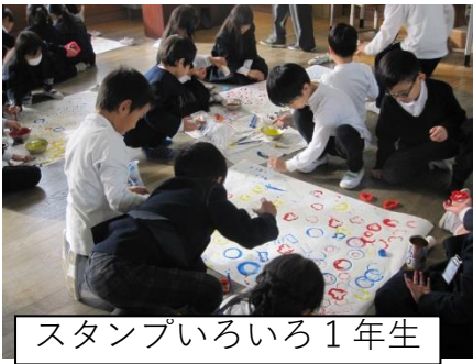
スタンプいろいろ 1年生