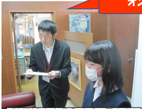
防災博士意見発表会 優良賞