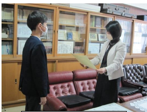
桃源郷駅伝競走大会 区間賞 2区 3位