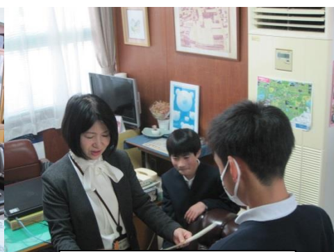
桃源郷駅伝競走大会 区間賞 4区 3位