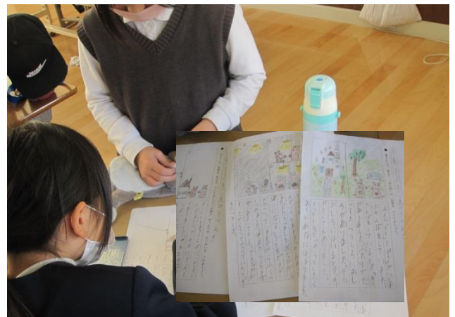
2年生 想像をどんどん広げた楽しいお話作り