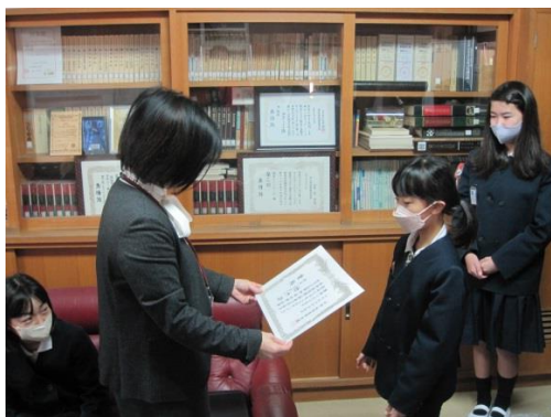
和歌山県学校美術展（絵画）