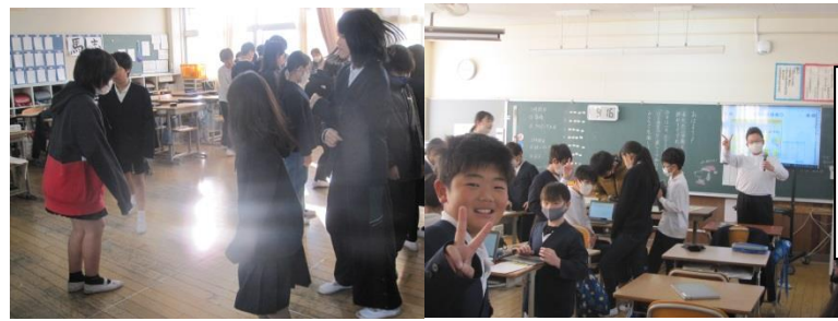
クラスで工夫がいっぱいお楽しみ会 5年生