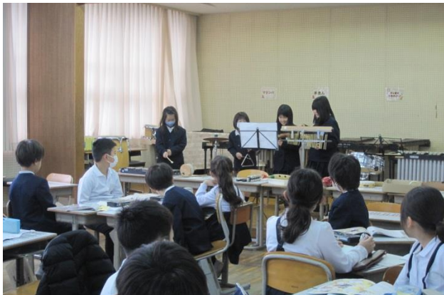
3年生 グループで作った「まほうの音楽」♪♪