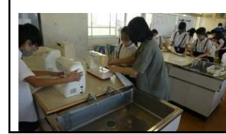
←6年生のナップサック作り

ボランティアさんとの結びあい、学びあい、支えあいが始まりました 毎年本校では、多くの共育ボランティアさんの協力をいただき、子どもたちの学びを支えていただいています。今後も計画を進めていきます。