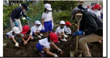
1年生のサツマイモの収穫→

修学旅行に行ってきました 10月16日（金）17日（土）の二日間、奈良・京都方面に修学旅行に行ってきました。