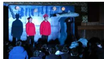
6年・那賀高校演劇部「やまなし」