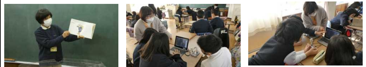
【読み聞かせ】本年度終了 【5年】プログラミング教育・信号機制御

タブレットパソコン（PC）を活用するために 昨年度末から、1人1台のタブレットPCを配付し、各ご家庭でも活用いただいているところです。Wi-Fi環境がなくてもログインして使えるのが、タブレットドリル（国語と算数）やカメラ機能です。Wi-Fi接続できると、学校と同じようにネット検索やロイロノート、teamsなどが使えます