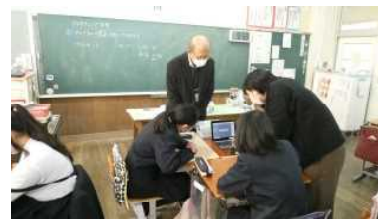
【6年】プログラミング