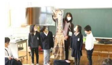
【1年】動物の赤ちゃん