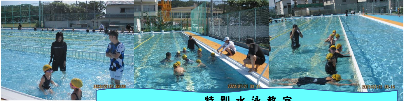
特別水泳教室 水中にもぐる、浮く、泳ぐことができるようになってきましたね🌻