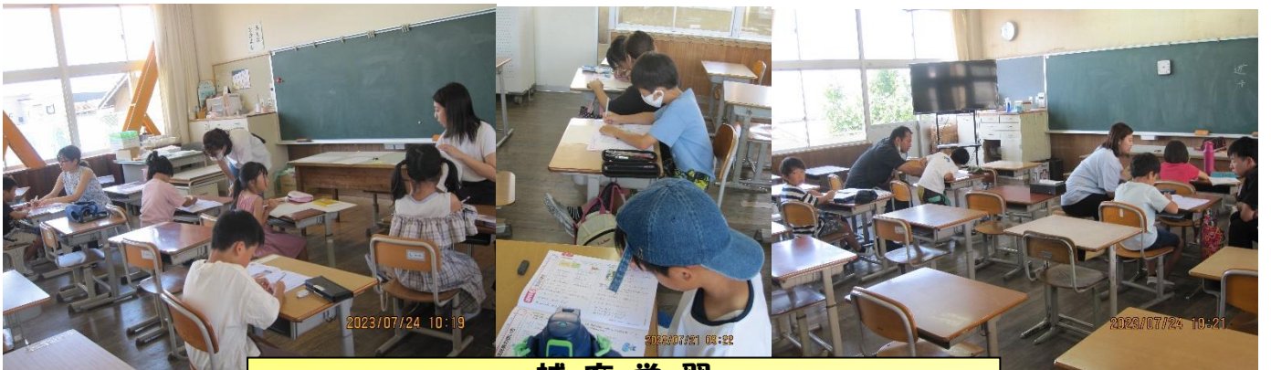
補充学習 みんな集中して、学習を次々と進めていきました🌻