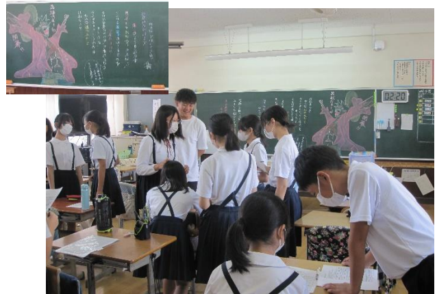
6年生 コミュニケーションゲーム学級活動