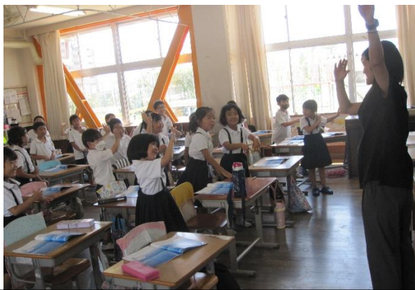
1年生 振り付けも考えて歌った音楽の時間

2学期 始業式 「校報ねごろ」にも掲載しましたが、始業式の前に、岩出市各種スポーツ少年団の全国大会出場者紹介と子ども防災博士意見発表会出場者の作文発表を行いました。式では、楽しい行事等も多い2学期も、 一人一人がみんなのために動き、たくましく ねほい強く やり抜こう 、普段から根小のみんなの登下校や運動場で活動する姿や声を見たり聞いたりして、元気になる、幸せを感じてくれている地域の方々がいらっしゃるという話を校長からしました。教頭先生からは、これからも大切な熱中症対策に関するクイズとお話がありました。