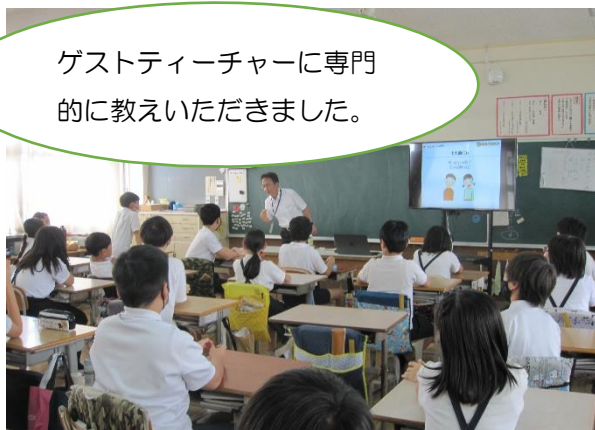
5年生 KDDIスマホ・ケータイ安全教室◎