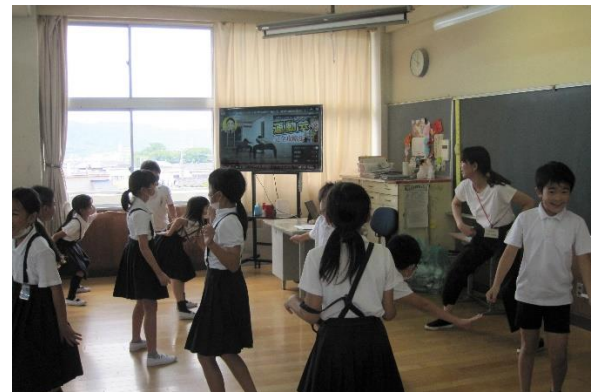
4年生 ソーラン節～踊って熱気むんむん♪