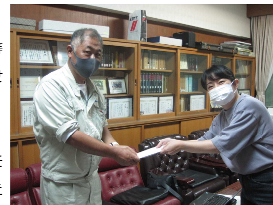
育友会会長と森南第一自治会会長代理者様

今後とも、根来小学校の子供たちを地域で見守っていただき、ご支援いただきますようお願いいたします。