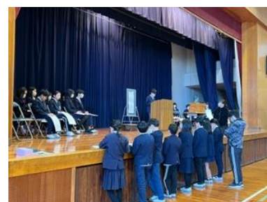
オンライン選挙の様子

1月16日（火）の児童会役員選挙（オンライン）で選ばれた 5人の新役員（5年生） が、朝のあいさつ運動を引き継ぎました。