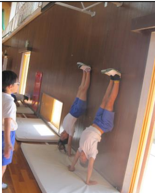
4年生 体育マット運動 友達とともに技をみがいて