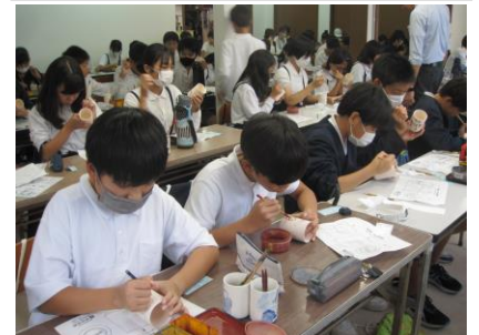
6年生 修学旅行 清水焼 湯のみ絵付け体験