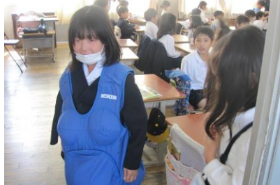
2年生 保健師さんとともに 命の大切さを知る授業