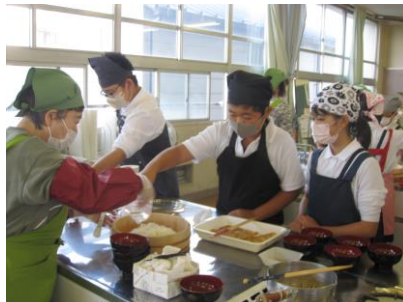
5年生 JA 出前料理教室 絶品☆手作りいなり寿司