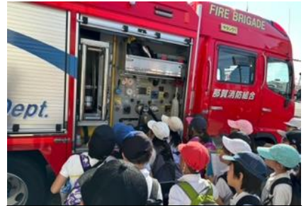
3年生 校外学習 那賀消防組合中消防署を見学