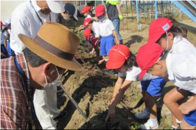
1年生・たんぼほ学級 ボランティア先生と いもほり

あきの いろいろな秋を楽しみ、たくましく あきの ねばり強く あきの やり抜く あきの ねごろっこ