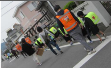
4月当初の1年生下校引率