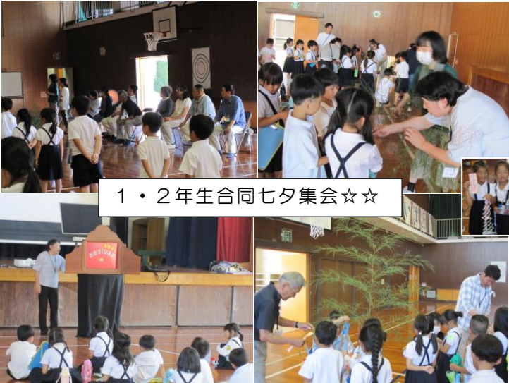
1・2年生合同七夕集会☆☆