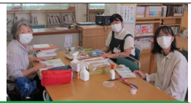
学校司書とともに図書修理