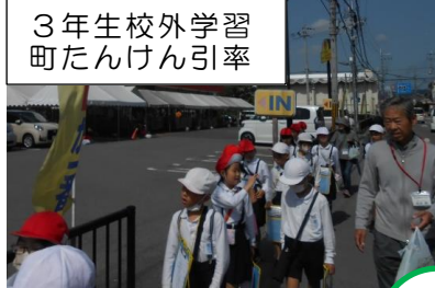
3年生校外学習 町たんけん引率