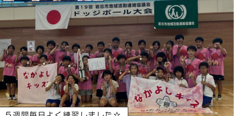
5週間毎日よく練習しました☆

7/6(土)第19回岩出市地域活動連絡協議会ドッジボール大会でAチーム優勝、Bチーム3位、おめでとう!! 先生たちも応援に駆けつけました。