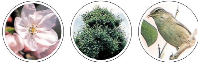
市の花「さくら」 市の木「うばめがし」 市の鳥「うぐいす」