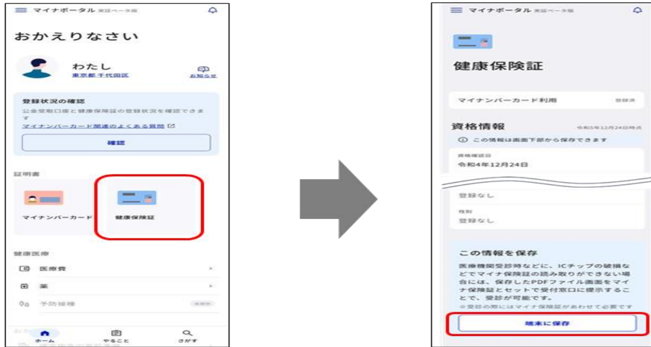
端末にダウンロードされるPDFファイルのイメージ