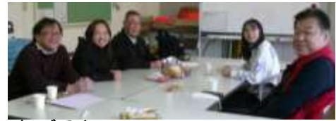
ねごろカフェで交流↑