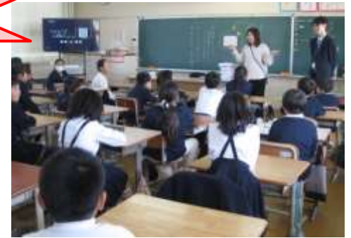
各学年の学級開き～わくわくドキドキ

入学式の翌日から4日間、1年生の7つのコース別集団下校の際、毎年、たくさんのボランティアの方々が入会して下さっています。4月10日(金)の第1日目は、雨の降る中でしたが、お陰様で、1年生の子たちは、傘をさしながらの初めての下校を、安全に終わることができました。学校や通学路途中に迎えに来て、一緒に歩いて帰って下さっている保護者の皆さんも、ご協力ありがとうございます。