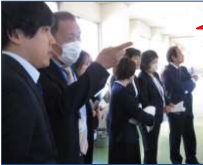
新任式後～新任教員による授業観察