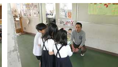
【先生インタビュー・2年】