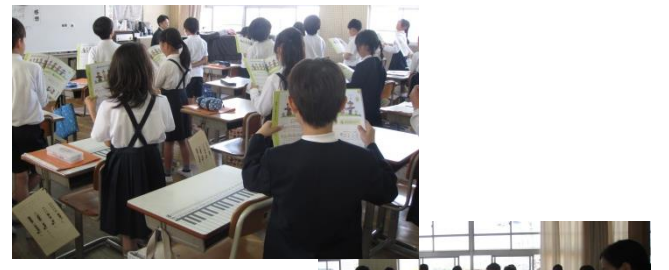
4年生 クラスで一つになったきれいな歌声が響きわたっていた音楽の時間～♪