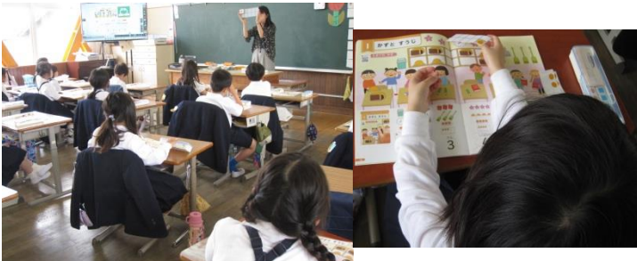
1年生 数図ブロックを使ってさんすうの学習