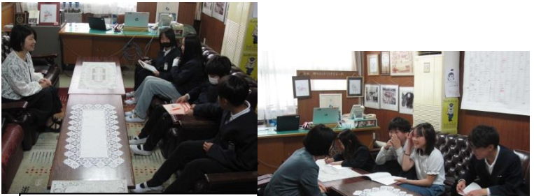
深掘りするインタビューがどんどん上手になっていく!! さすが 6年生 の国語科学習活動