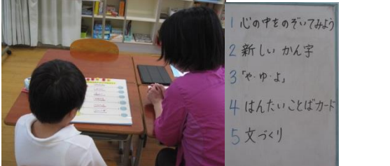
サポートルーム 心の内を明かして、先生と色々な話題でコミュニケーション(^^) /