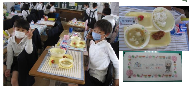
2年生 市制施行20周年記念給食にニコリ(^^) /